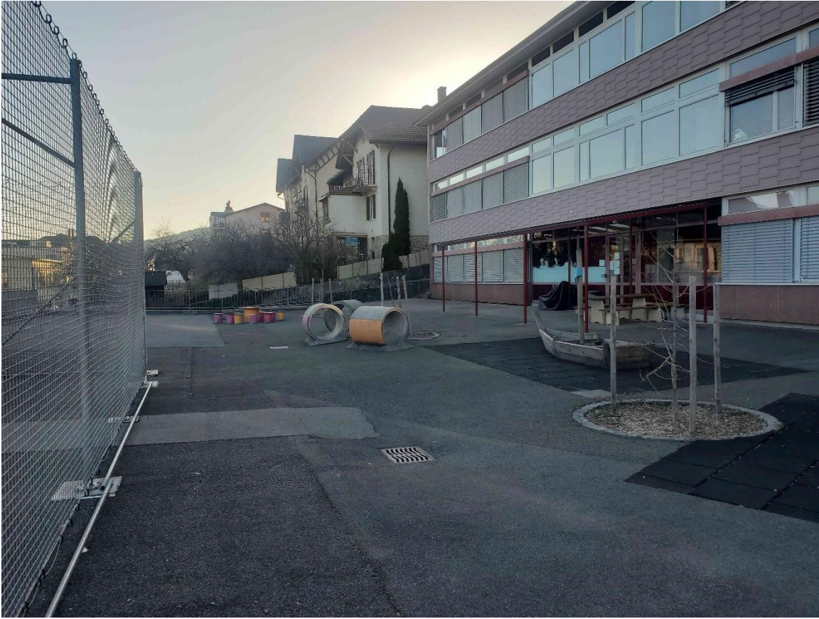
Figure 2 : illustration de la cour d'école de Fontainemelon (Bellevue 3)