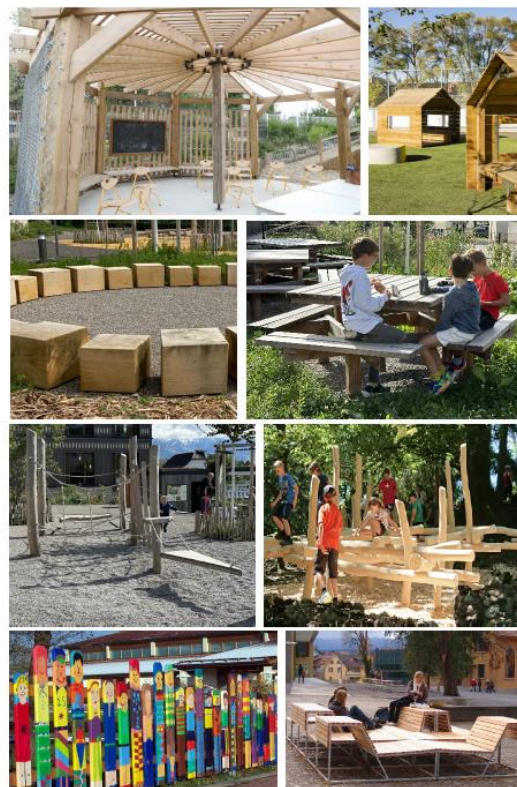
Figure 3 : projet de la cour de l'avenue Robert 28 à Fontainemelon