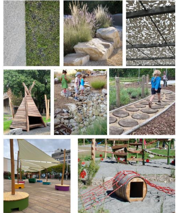
Figure 4 : projet de la cour de Bellevue 3 à Fontainemelon