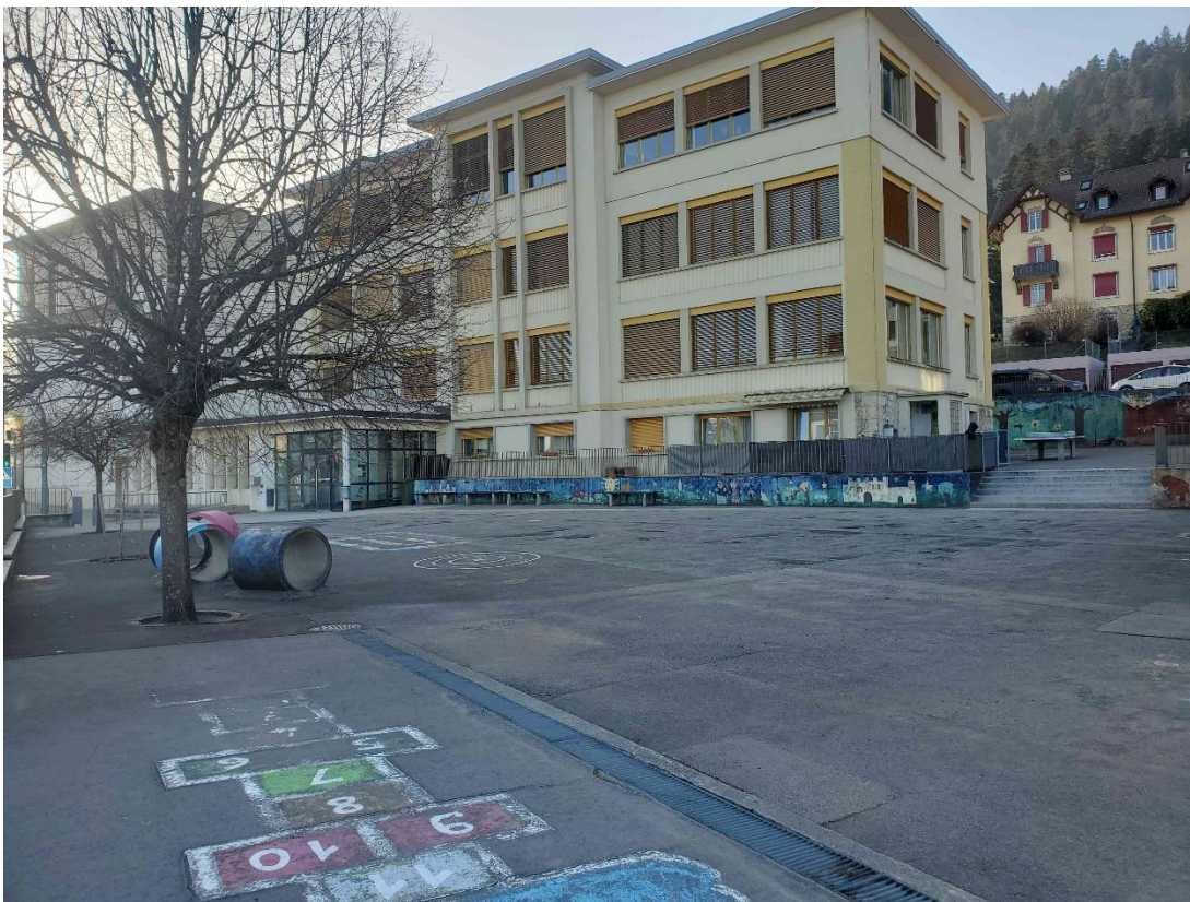
Figure 1 : illustration de la cour d'école de Fontainemelon (Av. Robert 28)

D'ailleurs, les réflexions pour la cour du collège des Geneveys-sur-Coffrane ont déjà débuté en février 2026 et devraient se terminer à la fin de l'année scolaire 2025-2026.