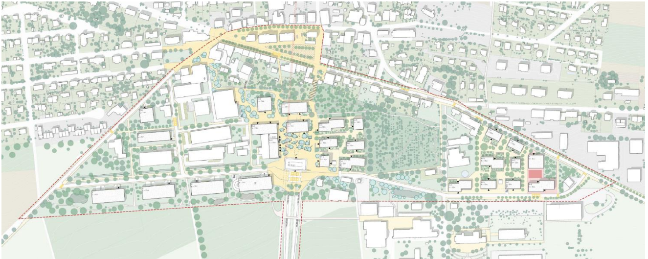
Figure 2 : plan du dialogue final, projet lauréat KM1 – KCAP/Metron ; rapport du collège d'experts relatif aux mandats d'étude parallèles, mai 2025