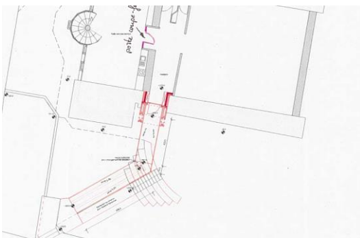
Figure 2 - Plan de l'étage

Le départ de la rampe d'accès est situé au point le plus élevé de la parcelle pour réduire la pente au minimum (norme : 6% de pente).