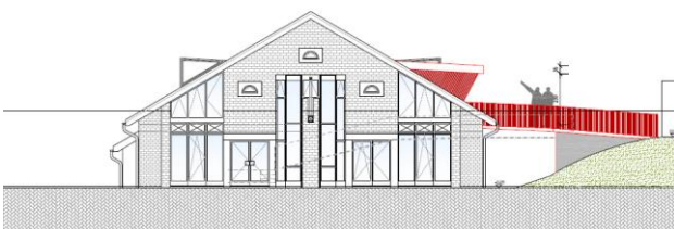
Figure 3 - Profil vue façade nord

Les modifications à apporter en façade et en toiture sont minimales, la disposition existante se prête bien au nouvel accès.