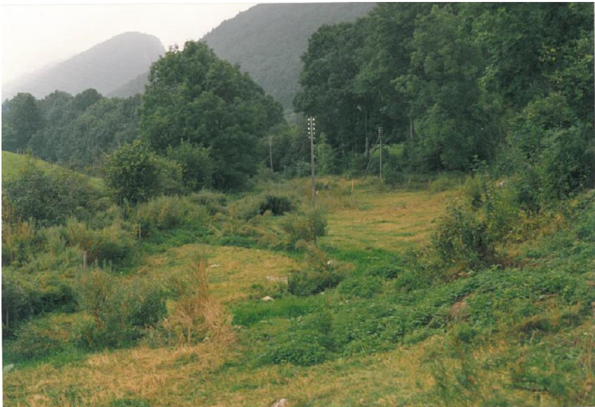
Figure 2 - Extrait du rapport "STEP du Pâquier - Réalisation et fonctionnement" - Tome 1, 1993

L'accès au site (filtre et étang) ne permet que l'usage de petits véhicules par temps sec, ce qui est pénalisant pour l'entretien.