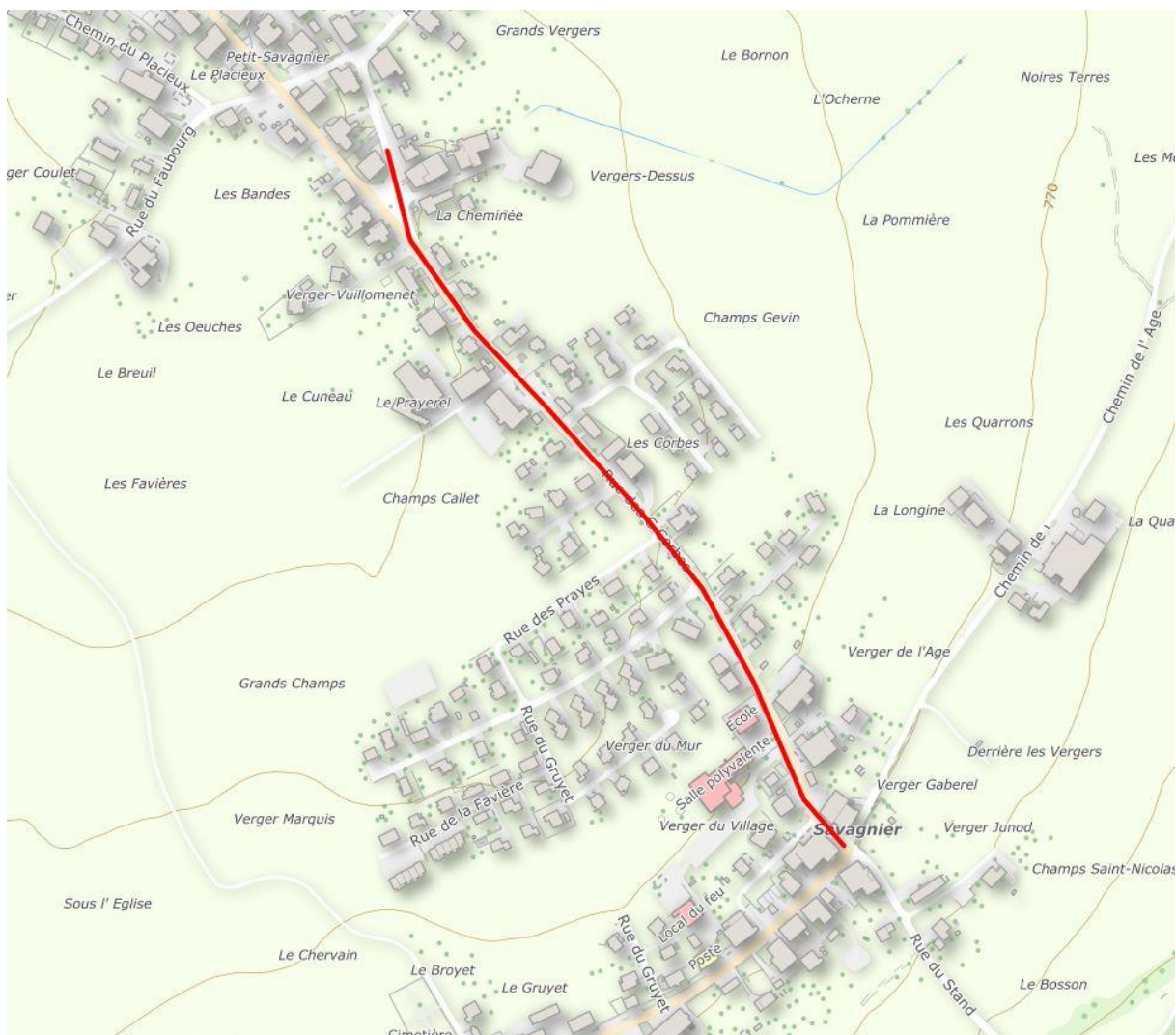
Figure 1 : Tracé concerné – 740 m

Le projet retenu s'inscrit dans l'emprise du chantier de la route cantonale, soit environ 740 m, dans la partie sud du village, depuis le carrefour de la Rue des Corbes/Rue des Forgerons jusqu'à la Rue du Recey (Auberge du Petit Savagnier).